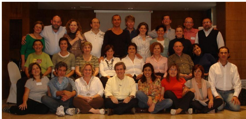
Promoción Formación Internacional 2009